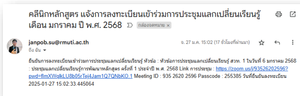
ภาพที่ 1.4 การแจ้งผลการลงทะเบียนผ่านทาง e-mail

คณาจารย์และบุคลากรที่ลงทะเบียนเรียบร้อยแล้ว ระบบคลินิกหลักสูตรจะมีการแจ้งผลการลงทะเบียนผ่านทาง e-mail ที่ลงทะเบียน โดยมีรายละเอียดต่าง ๆ ดังแสดงในภาพที่ 1.4